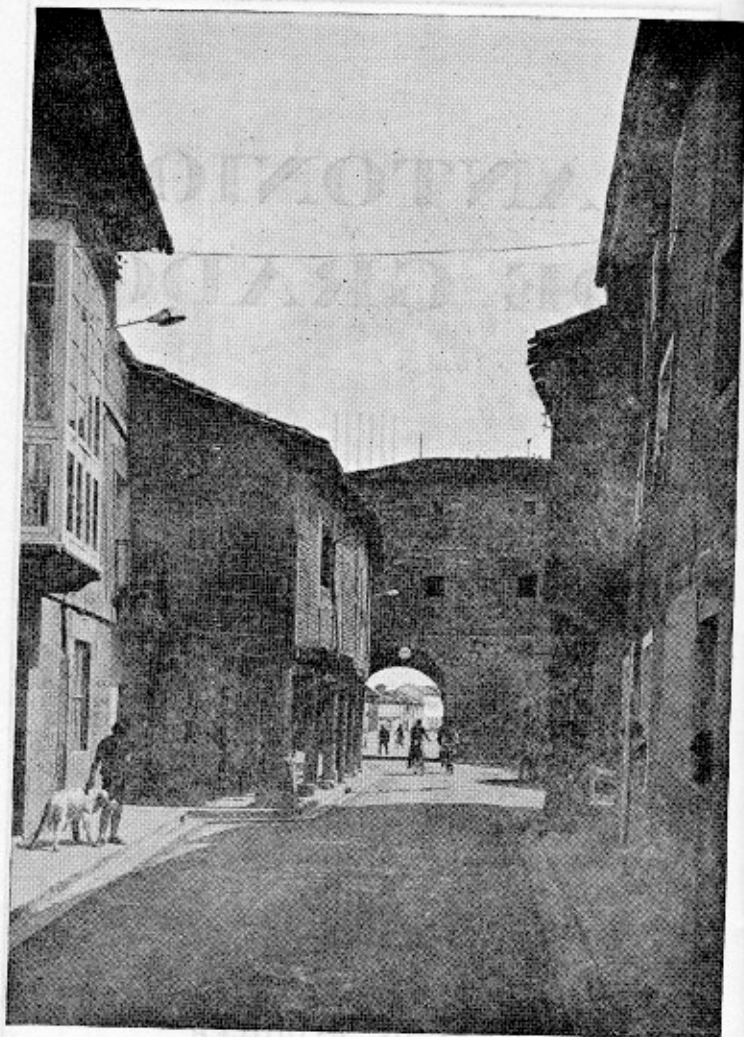
ARCO DE LA CARCEL